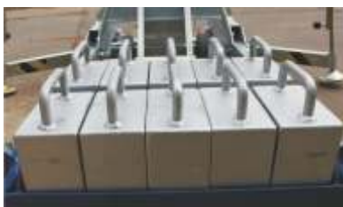
10 Stück Kontergewichte - 20 kg/Stück