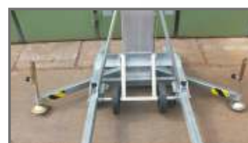
Für den sicheren Stand werden seitlich Spindelausleger montiert.

Haas Minikrane GmbH - Schwochau 1 b - 01623 Lommatzsch