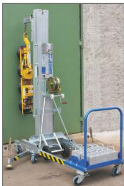
LMX 500 - mit Lastenhaken und Glassauger für die Montage von Glasscheiben