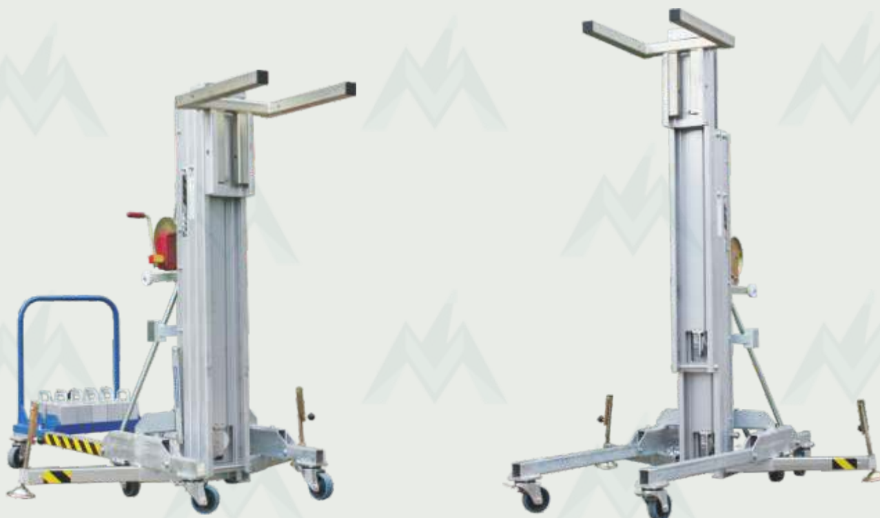
Lastenlift mit Lastengabel und Kontergewichte bzw. Wechselfahrgestell

Der "Lastenlift LMX 500 W" ist ein Hebe- und Montagespezialist speziell wenn Montagen direkt an einer Wand oder anderen Hindernissen durchgeführt werden müssen. Durch extrem kurze vordere Ausleger und eine ebenfalls verkürzte Lastgabel können Arbeiten wie die Montage von Glasscheiben, Dachkonstruktionen für den Lüftungsbau, Markisen problemlos durchgeführt werden. Der Lastenlift ist hinten mit zusätzlich 10 Kontergewichten ausgestattet und erreicht dadurch eine maximale Nutzlast von 500 kg. Durch sein geringes Eigengewicht von 199 kg (ohne Kontergewichte und Ausleger) kann er problemlos verladen und transportiert werden.