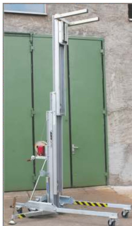
Lastenlift voll ausgefahren mit Wechselfahrgestell

Aufgrund der geringer Transportmaße von gerade einmal 1,99 m x 0,77 m passt das Gerät durch Standardtüren.