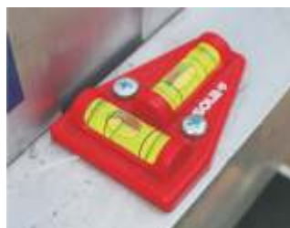
Wasserwaage - für den optimalen Stand