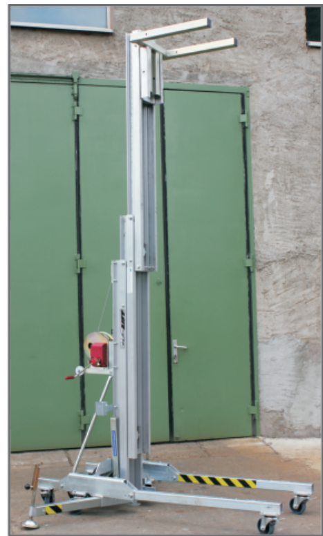
Lastenlift voll ausgefahren mit Wechselfahrgestell

Aufgrund der geringer Transportmaße von gerade einmal 1,99 m x 0,77 m passt das Gerät durch Standardtüren.