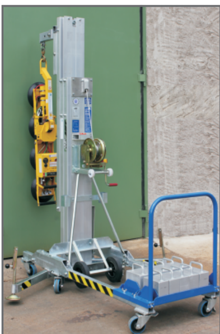
LMX 500 - mit Lastenhaken und Glassauger für die Montage von Glasscheiben