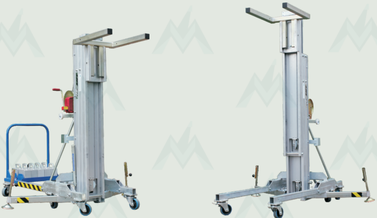
Lastenlift mit Lastengabel und Kontergewichte bzw. Wechselfahrgestell

Der "Lastenlift LMX 500" ist ein Hebe- und Montagespezialist speziell wenn Montagen direkt an einer Wand oder anderen Hindernissen durchgeführt werden müssen. Durch extrem kurze vordere Ausleger und eine ebenfalls verkürzte Lastgabel können Arbeiten wie die Montage von Glasscheiben, Dachkonstruktionen für den Lüftungsbau, Markisen problemlos durchgeführt werden. Der Lastenlift ist hinten mit zusätzlich 10 Kontergewichten ausgestattet und erreicht dadurch eine maximale Nutzlast von 500 kg. Durch sein geringes Eigengewicht von 199 kg (ohne Kontergewichte und Ausleger) kann er problemlos verladen und transportiert werden.