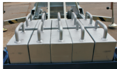
10 Stück Kontergewichte - 20 kg/Stück