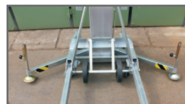
Für den sicheren Stand werden seitlich Spindelausleger montiert.