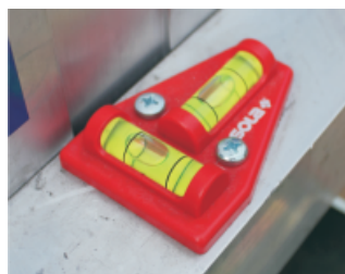
Wasserwaage - für den optimalen Stand