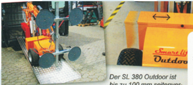
IFTen transporteret let i en varebil eller på en trailer.

Der SL 380 Outdoor ist bis zu 100 mm seitenverschiebbar zur Feinjustierung beim Fenstereinbau.